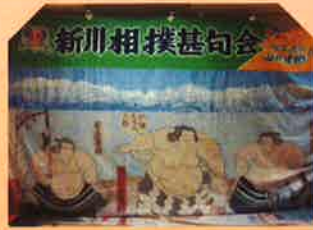
新川相撲甚句会の皆さん