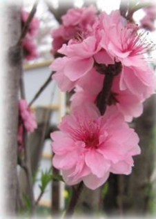
花の森 天神山ガーデン