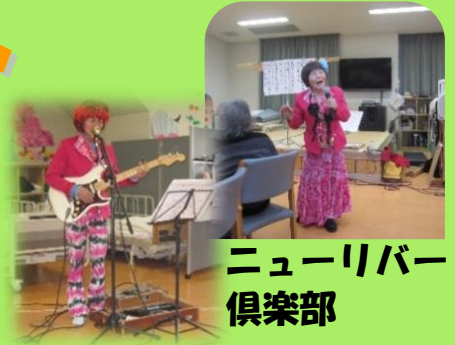
ニューリバー 倶楽部