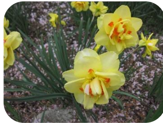
色とりどりの花に 囲まれてハイ、チーズ!