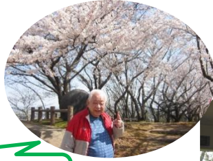
桜をバックに記念撮影