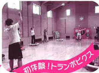
初体験!トランポピクス