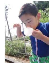
風船、ゲット!? 風船を網ですくいをした