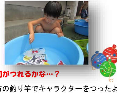
何かつれるかな…? 磁石の釣り竿でキャラクターをつったよ