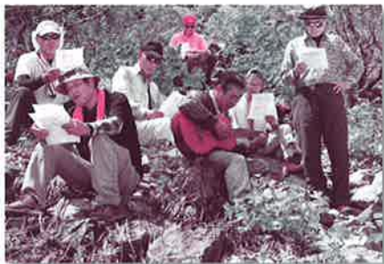
「団塊サロン」の様子。 白馬大雪渓で「ギターで歌おう」