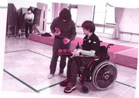
活動内容はボール拾いや道具の出し入れです。

いつもは受け入れ側でしたがボランティア活動をすることで、「それいゆ」の活動を支えているボランティアさんへの思いが深まり、今後ももっと多くの人たちと一緒に活動したいと強く願っています。