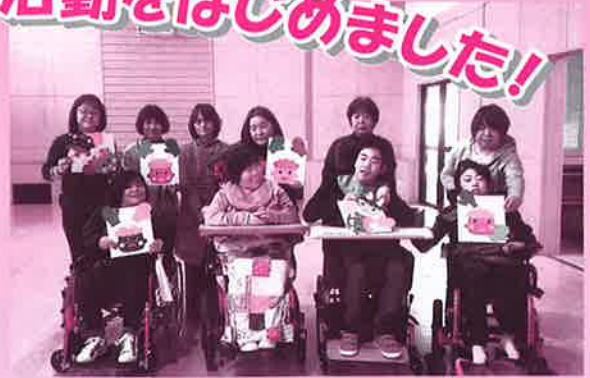
新川地区重症心身障害児(者)親の会