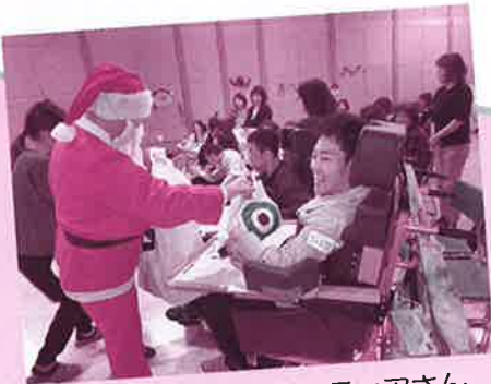
クリスマス会のボランティアさん

発足当初は、子どもたちがまだ就学中で、学校卒業後に通所できる場所を作るために活動していました。