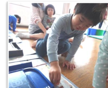
パトカーや救急車を出勤させて みんなで遊んでいます♪