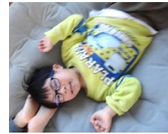
寝転がっても、気持ちがいいよ!