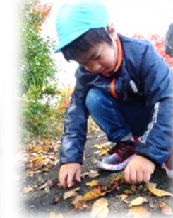
どんぐり いっぱいあったよ!