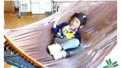
ゆ〜らゆ〜ら! 揺れてま〜す!

身体を使った遊びでお子さんと楽しんでみてください! 身体を回転させる、揺らす、弾ませるなど、身体を使った遊びを通して全身に伝わる感覚が脳を刺激し、脳の働きを活発にさせます。