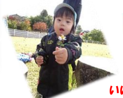
いいもの みつけた!