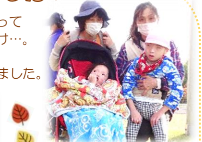
散歩は気持ちいいな~