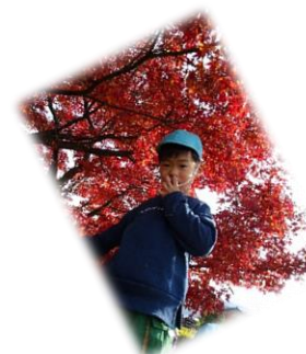
紅葉がきれいだったよ

天気の良い日、トンネル上の「大光寺パーク」まで散歩に行きました。秋ならではのどんぐり拾いをしようとお出かけ...。ところが広い芝生を見ると、気持ちがうきうきの子どもたち。みんな、それぞれの遊びに夢中になっていました。