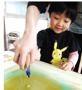
どんな模様になるかな~