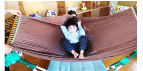
ハンモック 乗り方いろいろ!