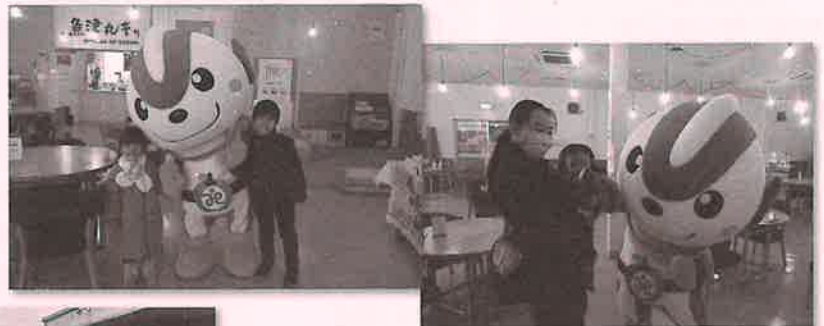
▲みらパークイベント会場にて▲