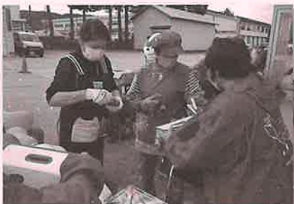
▲上野方軽トラ野菜市にて▶