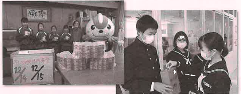
▲清流小学校、西部中学校の学校募金▲