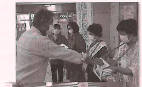
▲サンプラザ街頭募金にて