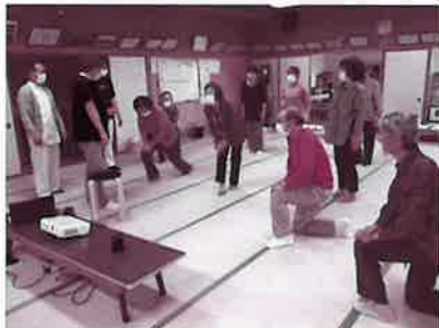
▲接骨師会さんによる転倒予防体操