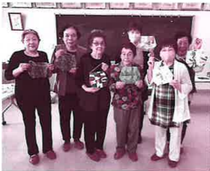
▲レター入れの創作教室