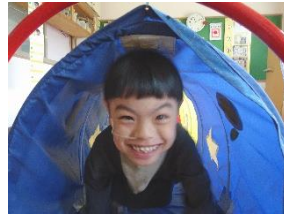
トンネルのこいのぼりに挑戦!