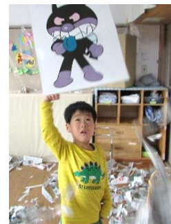
新聞を丸めて的あてしたよ!

新聞遊びは、手で触れ、新聞を丸めた時や破った時の音を聞き、新聞をパラパラと降らせると目で追い、いろいろな感覚を使って遊ぶことができます。 園でも、たくさんの新聞を使って、みんなで楽しむことで友達の様子が刺激となって「やってみよう」と遊びに取り組める子もいます。