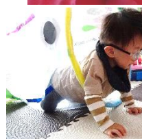
こいのぼり、おおきい!