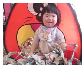
新聞遊び、おもしろいな~!

今年度、初めての行事は、4月のお誕生会! 4月生まれのお友達をお祝いして、みんなで新聞遊びを楽しみました。