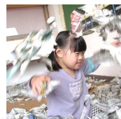
新聞を 降らせるぞ~!