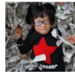
新聞のお布団だよ