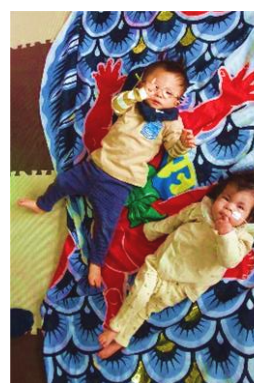
こいのぼり、おおきい!