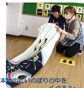
本物のこいのぼりの中をくぐるよ~

子どもたちが毎日元気に過ごせますように…と集会をしました。いろいろな「こいのぼりくぐり」に挑戦しました!