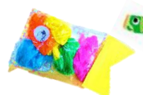
こいのぼり、おおきい!