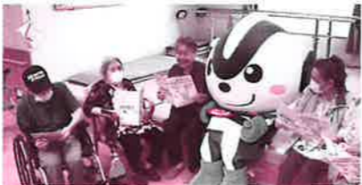
▲成年後見支援センターをPRするうおっしゃくん