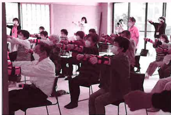
▲百歳体操を行う利用者

開催日 毎週金曜日10:00~14:00 会場 吉野公民館(上中島公民館となり) 料金 利用料100円、弁当400円(希望者のみ) 問合せ 魚津市地域包括支援センター ☎23-1294 上中島地域振興会(上中島公民館) ☎22-0373