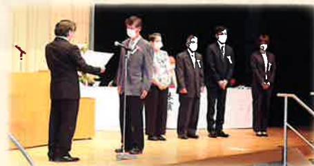
▲第71回 魚津市社会福祉大会 表彰式の様子