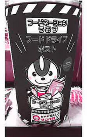
→ハロー魚津店の回収ボックス