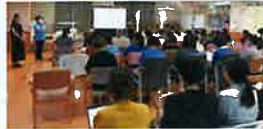
▲7/30「ユマニチュード」インストラクターによる公開講座を開催しました

ユマニチュードとは、「人間らしさを取り戻す」ことを意味するフランスで生み出された認知症ケア技法で、今、日本でも注目を集めています。認知症の方は、介護者を拒絶したり、感情的になったりすることがあります。介護動作の中に、「あなたのことを大切に思っています」というメッセージを伝える技術がユマニチュードです。