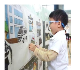
アンパンマンのおくちにあーん!