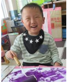
ふわふわ〜。たのし〜い!!