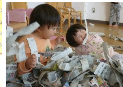
シャカシャカたのしい♡

新聞あそびは、身体全体を動かしながら、手や指先の感覚を養います。新聞を通して全身を動かす粗大運動や、手先を細かく使った微細運動をさかに行ないます。新聞紙をちぎったり丸めたりすることは、手や指先の力を養うことにつながります。