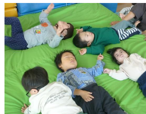
ふわふわ、きもちいい♡

外遊びがなかなか難しくなる季節。でも・・・園の中では毎日遊びを変えて、体にいろいろな感覚をいっぱい入れて遊んでいます。