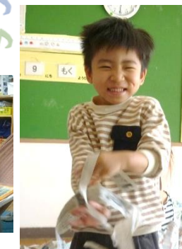
たくさんまわしてね♡