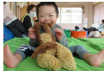
お気に入りの場所だよ♡