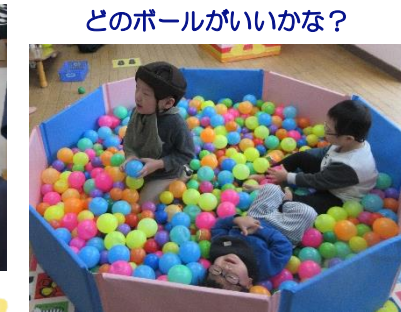
どのボールがいいかな？

ボールプールは、身体の感覚統合や基本的な運動能力の発達を促す重要な役割を果たします。ボールプールに触れることで、指先の触覚やボールの柔らかさや重さなどの違いを体験し、触覚の発達を促してくれます。