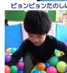
ピョンピョンたのしいよ！