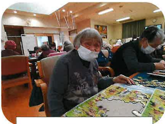
パズルで脳トレーニング