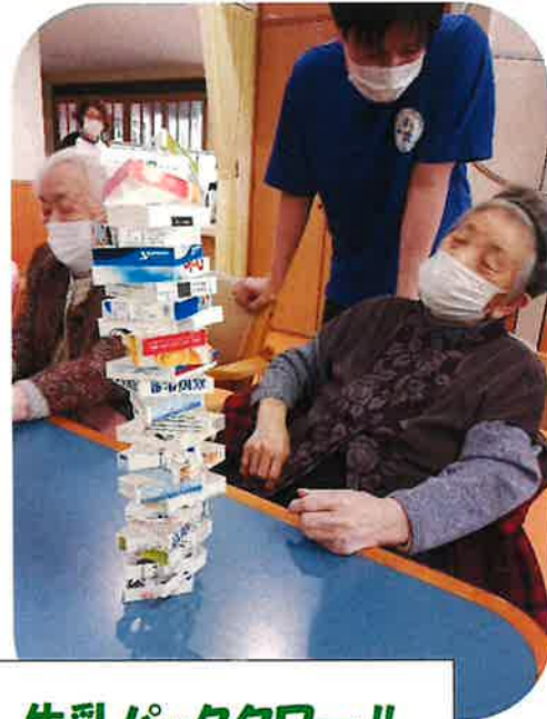
牛乳パックタワー!!