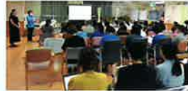
▲7/30「ユマニチュード」インストラクターによる公開講座を開催しました

ユマニチュードとは、「人間らしさを取り戻す」ことを意味するフランスで生み出された認知症ケア技法で、今、日本でも注目を集めています。認知症の方は、介護者を拒絶したり、感情的になったりすることがあります。介護動作の中に、「あなたのことを大切に思っています」というメッセージを伝える技術がユマニチュードです。