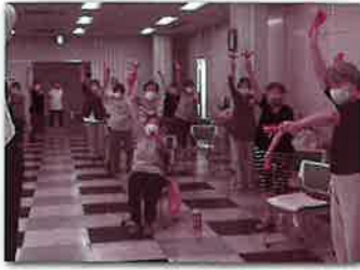
▲心も体も元気に! 高齢者の介護予防事業