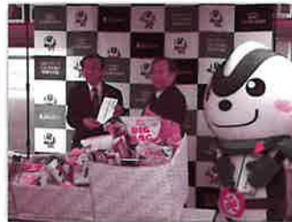
▲食料支援による支え合い