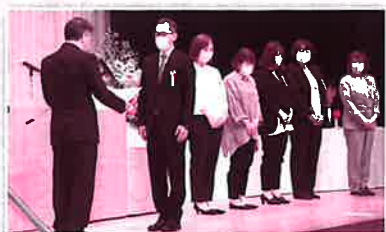
▲第72回魚津市社会福祉大会表彰式の様子