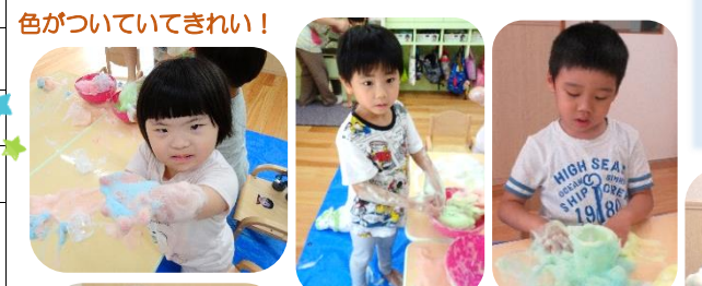
色がついていてきれい!