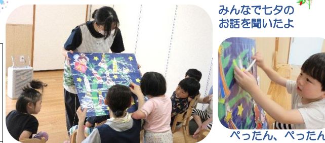
みんなでセタのお話を聞いたよ