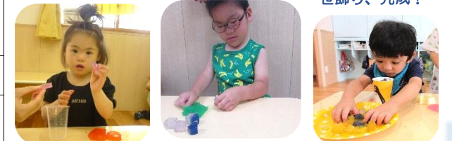
べったん、べったん 笹飾り、完成!