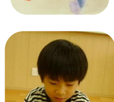
カップに入れて 出来上がり!