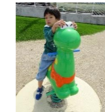
揺れる感覚は体幹鍛えます