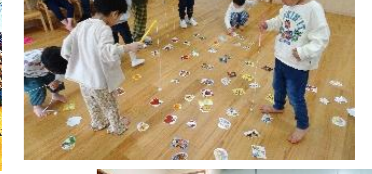
個別課題遊びも楽しめます