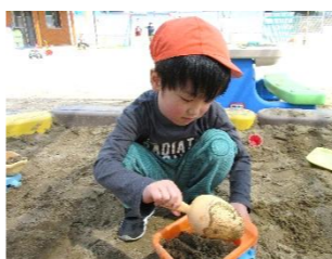
砂は最高の感覚刺激