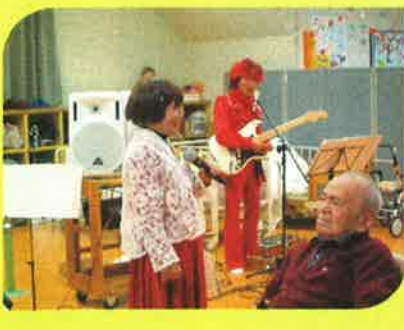
ニューリバーさん