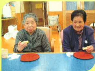
恵方を向いていただきます