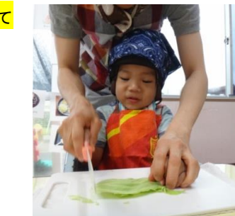
手でしっかり押さえてキャベツを切る