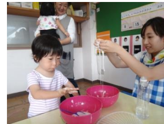
ぐにやぐにや気持ちいいね♪