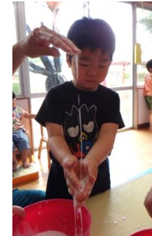
どこまでのびるかな~?!