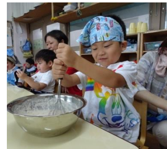
材料はいるといつもより力を入れて混ぜないと…!頑張るぞ~★

大人と一緒に包丁を使って材料を切ったり、具材を入れて混ぜて、やる気いっぱいの子もたち。大人が「〇〇したい人!」と聞くと、たくさんのお友達が元気よく手をあげてくれました。自分たちで作ることで、普段は苦手な野菜も食べてくれたり、みんなと楽しい雰囲気に完食されたお子さんもいました♪