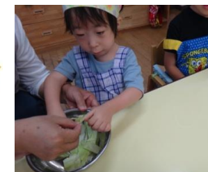
私は手も使ってちぎって入れたよ!