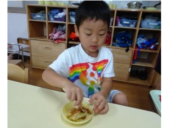
みんなで作ると更に美味しい!

大人と一緒に包丁を使って材料を切ったり、具材を入れて混ぜて、やる気いっぱいの子もたち。大人が「〇〇したい人!」と聞くと、たくさんのお友達が元気よく手をあげてくれました。自分たちで作ることで、普段は苦手な野菜も食べてくれたり、みんなと楽しい雰囲気に完食されたお子さんもいました♪