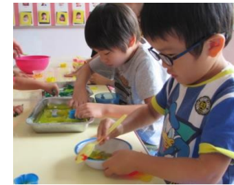
お友達はどんなふうで遊んでいるかな?